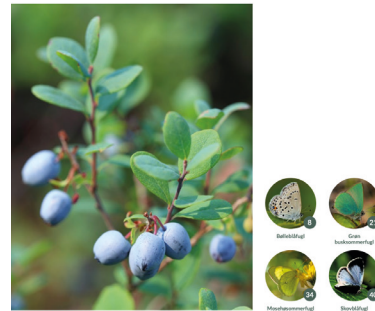
( Vaccinium uliginosum )

Kontakt bigruppen for katalog med 50 forskellige planter.