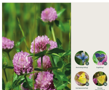
( Trifolium pratense )