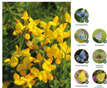
( Lotus corniculatus )