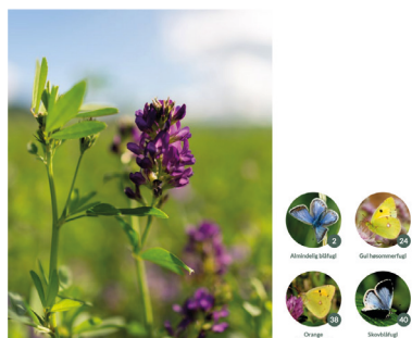
( Medicago sativa )