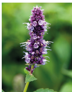
Anisisop ( Agastache foeniculum )