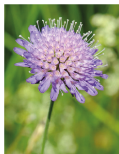
Blåhat ( Knautia arvensis )

Kontakt bigruppen for længere liste over planter.