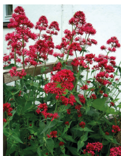
Sporebaldrian ( Centranthus )