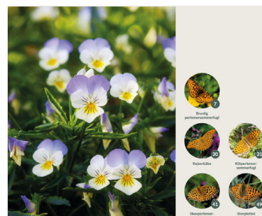
( Viola tricolor )