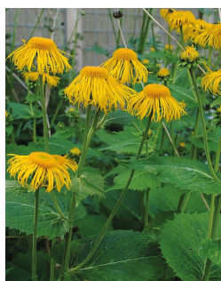
Tusindstråle ( Telekia speciosa )